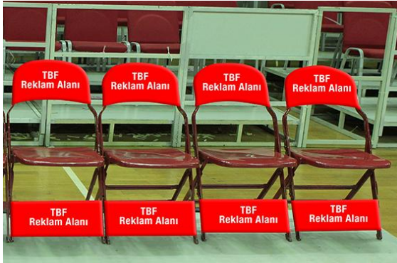
ÇİZİM - 8