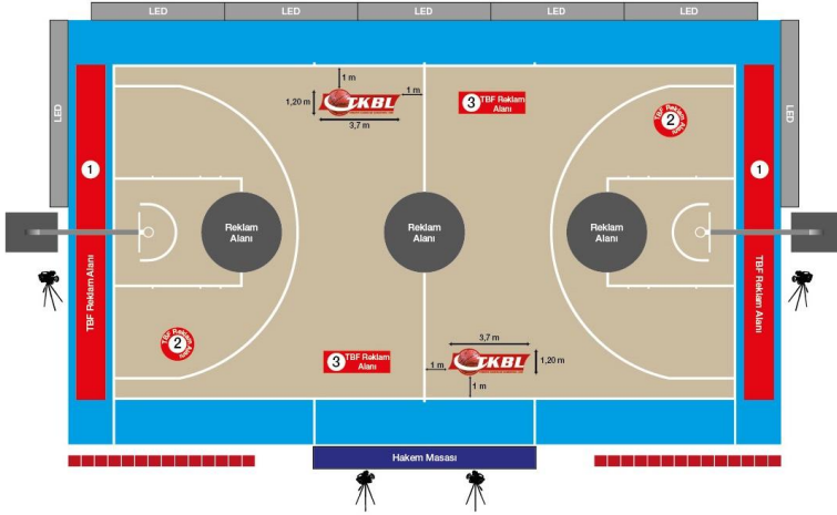
ÇİZİM - 7.b

78.3. Her bir kulüp, Ligin en büyük destekçisi olan Lig isim sponsorunun reklamının yayınlanabilmesi amacıyla elektronik reklam panolarında 150 saniye reklam yeri sağlayacaktır. Bu süre çıkarıldıktan sonra kalan sürenin kulüp ve TBF arasındaki paylaşımı, tarafların hakları her bir çeyreğe eşit olarak dağıtılacak şekilde, aşağıda belirtilmiştir.