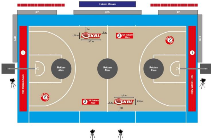
ÇİZİM - 7.a

79.2. Kulüp ve TBF arasında, reklam süresi hakları konusunda yapılacak paylaşım anlaşması ile elektronik reklam panoları, mülkiyeti TBF'ye ait olacak şekilde, TBF tarafından sağlanarak kulüplerin kullanımına sunulabilir.