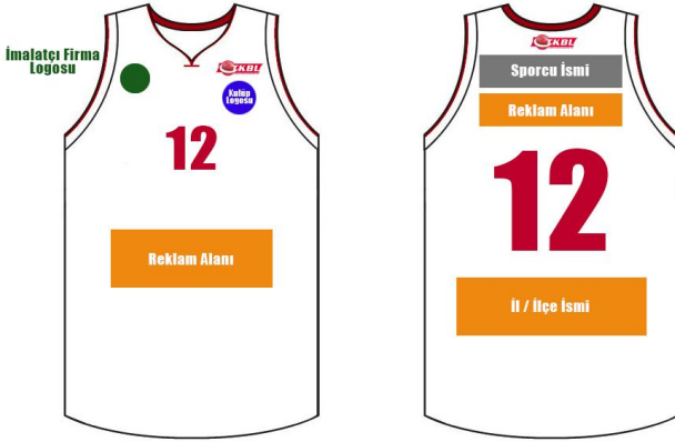
ÇİZİM - 10